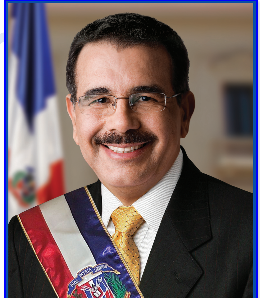
LIC. DANILO MÉDINA EXCELENTÍSIMO SEÑOR PRESIDENTE DE LA REPÚBLICA GESTIÓN DE GOBIERNO 2012-2016